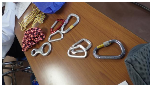
ロープワーク講座

例年は丹沢にて行われている安全登山技術講習会が本年度は新型コロナの感染症対策のため9月27日の日帰り実施となり、会場も県スポーツセンター内のスポーツ科学センターに変更をして実施されました。