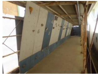
Top の高さは約 8 m !!