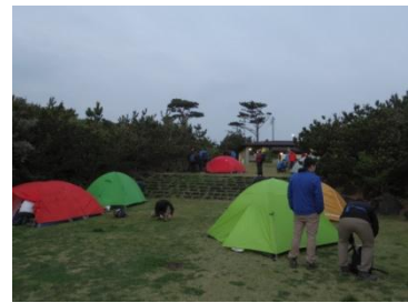
番外：みんなでキッチン