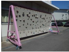
リニューアルした クライミングボード

昨年度末には クライミングボードがリニューアル し、春合宿では八丈島の八丈富士に行きました。