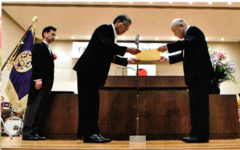
創立110周年記念事業実行委員会感謝状