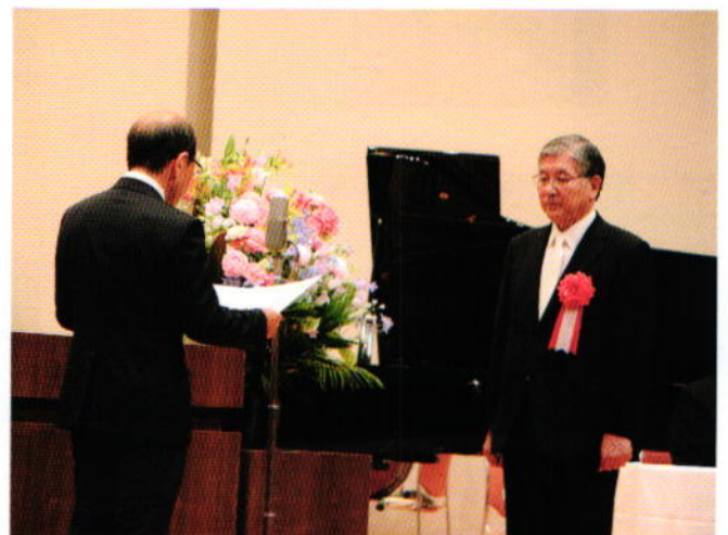
千葉県教育委員会感謝状