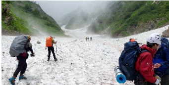
白馬岳（長野県） 2022年 7月21日(木)～23日(土)