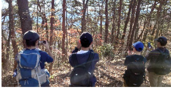
扇山（山梨県） 2021年11月13日(土) 新人大会