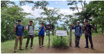
扇山・百蔵山（山梨県） 2022年6月4日(土)