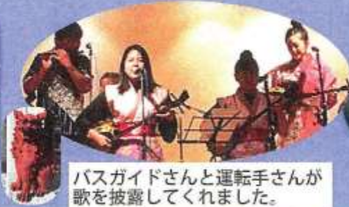
バスガイドさんと運転手さんが歌を披露してくれました。