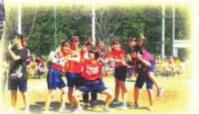
クラス対抗競技の成績