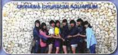
OKINAWA BIWAKAN AQUARIUM