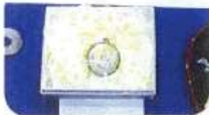
工芸の部 佳作 土屋 純己 (2年次)