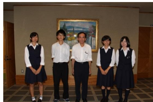
オランダ派遣生徒と記念撮影