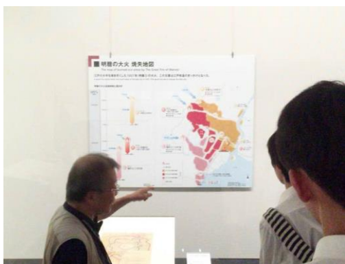
明暦の大火について