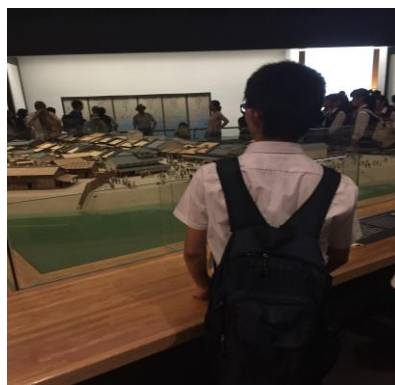
日本橋から見た江戸の町