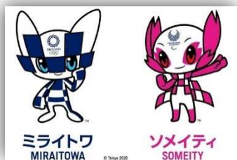
TOKYO2020 マスコットキャラクター

オリンピックやパラリンピックをテレビでじっくりと観戦し、日本選手を応援することができたのではないのでしょうか。私も様々なスポーツを通して、障害のある選手もそうでない選手も精一杯自分の力を出し切ろうとしている姿に、何度も胸が熱くなりました！みなさんにも、それぞれ素敵な翼がありますので、是非、やってみたい競技があったら挑戦してみたいはいかがですか？