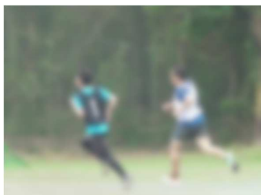
800m走 2分44秒 2年 Aさん