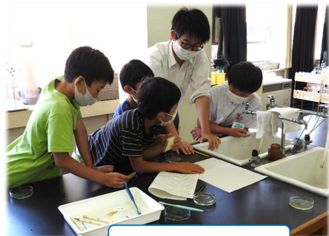
神宮寺小おもしろ実験室