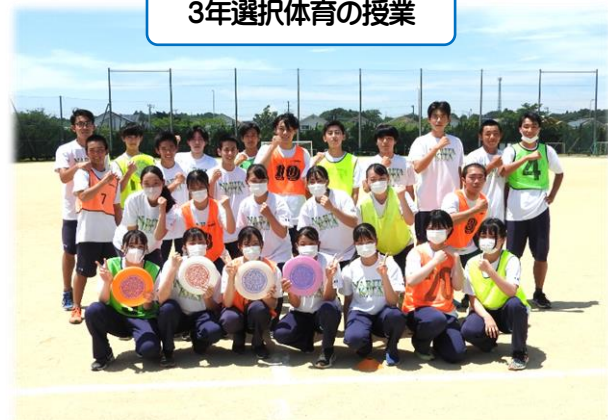
3年選択体育の授業