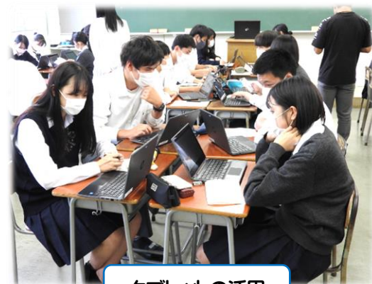
タブレットの活用