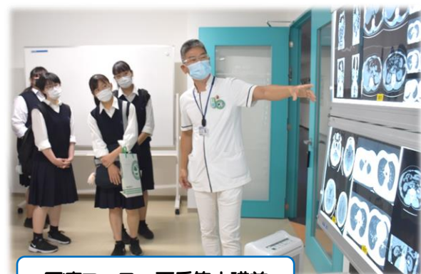
医療コース 夏季集中講義