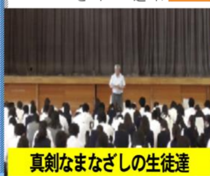
真剣なまなざしの生徒達

選択科目説明会 2年生・5月25日(木)6時間目、文理選択説明会が行われました。3年生になってからのコースや選択科目は、進路をしっかり考えたうえで、選択しましょう。