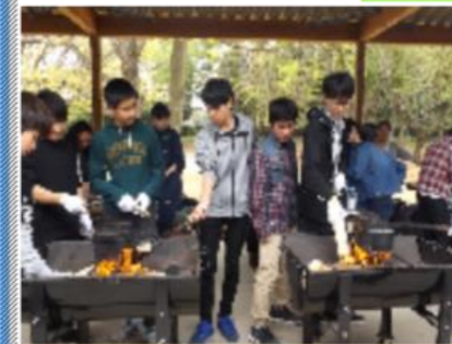
カレーライスづくり

校外学習 1年生が校外学習として「こもれびの森 イバライド」に行きました。飯盒炊飯ではカレーライスをづくりグループ活動にて新緑を深めました。室内でアイスクリーム作りをし「家でも出来そう」とレシピーメモする生徒の姿も見受けられました。自由行動では、活発・元気に活動する生徒の姿、楽しんで歩く姿が見られました。