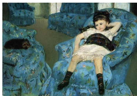
メアリーカサット 青い肘掛け椅子の上の少女