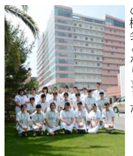
ユニフォームで体験実習(3年)

医療・福祉コースの授業も3年目となり、大きな節目を迎えます。今年度も、コミュニケーションの活動を通し、ますます魅力のある長狭高校となっていく様子をお伝えしていきます。(CS事務局)