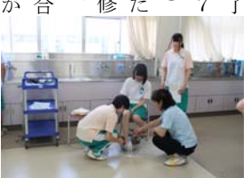
総合生活支援技術演習(3年)