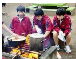
カレーを 作りました