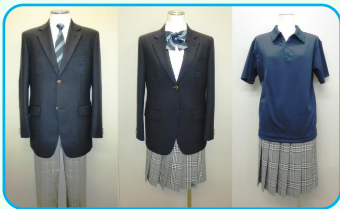
ポロシャツは夏服（男女共用）