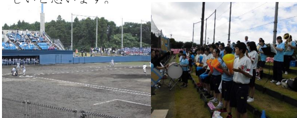
強豪相手に立ち向かいました

試合は残念ながら1-24の5回コールドで敗戦してしまいましたが、正規の野球部員6人と他の部員からの助っ人4人の合計10人で真っ向から勝負したことは、とても良い経験になったのではないかと思います。3年生はこの日をもって引退となりましたが、野球部で培ったことをこれからの将来に活かして頑張りたいと思います。