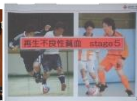
講師の方がご自身の経験も含めてお話して頂きました。