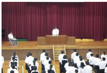
始業式での校長先生の挨拶と、その話を真剣に聞く生徒たち。

2学期は、黒潮祭(文化祭)・秋期スポーツ大会・修学旅行などの大きな行事がたくさん控えています。いち早く夏休みから気持ちを切り替え、一人ひとりが行事の意義をしっかりと理解し、それぞれの行事に真剣に取り組んでいってほしいと思います。