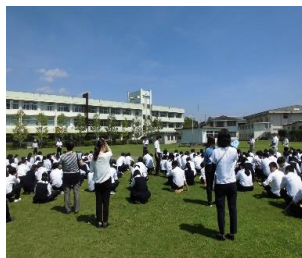
グラウンドに速やかに集合し、点呼をとって報告しています。

「訓練は本番のように」「本番は訓練のように」を意識し、いざというときに自分の命を自分で守ることができるよう備えていってほしいと思います。