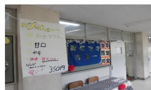
3年2組の駄菓子屋・インスタ映えスポット 1年1組のカレーライス屋