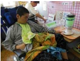
< 工芸班 >