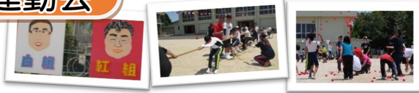
平成28年度テーマ「みんな主役の運動会」