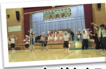
平成28年度テーマ「みんなでハッピー樹望祭」