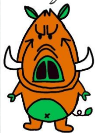
公式マスコットキャラクター