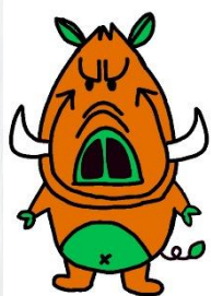
市原緑高校 公式マスコットキャラクター