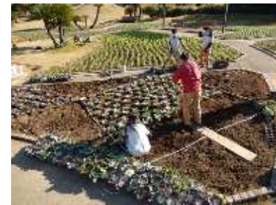
植栽時の様子：（株）ネクスコ・メンテナンス関東の職員2名と一緒に植栽をしました