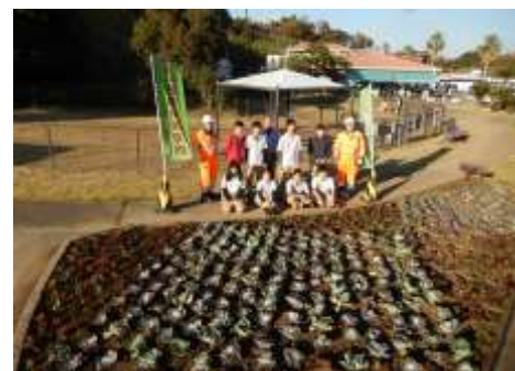
（株）ネクスコ・メンテナンス関東の職員の方と一緒に記念撮影