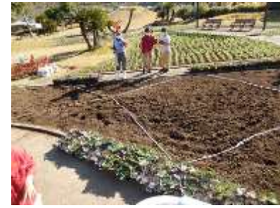
木の棒2本使い、ひもで植栽する場所を区切ります