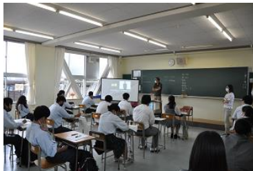
ビデオ視聴時の様子1

7月28日(火)の1・2時間目を使い、3学年は4会場に分かれて面接対策指導を行いました。最初の20分間は、面接ビデオを視聴しながらワークシート(「面接マナー必勝ガイド」面接まとめ編)に記入して、面接を受ける上でのポイントなどを整理していきました。その後、会場ごとに講師となった先生方が、個人面接、グループ面接の受け方について指導助言をしてくださいました。本番に向けて、面接指導で学んだ注意点等に気をつけながら家庭でも繰り返し、繰り返し練習をしてください。