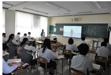
ビデオ視聴時の様子2