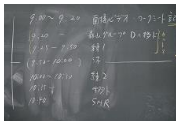
本時のタイムスケジュール