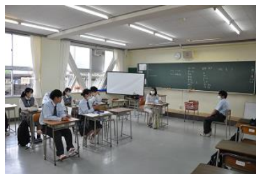
面接練習時の様子1 生徒も面接官となり 気が付いた点について アドバイスを行っていた