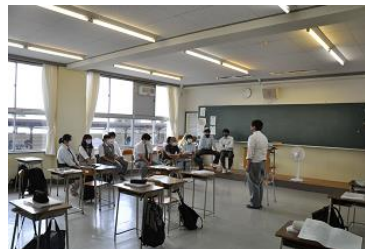
面接練習時の様子2