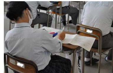
ワークシートに記入する生徒