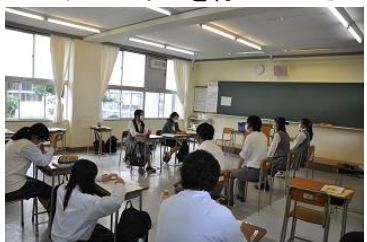
面接練習時の様子3