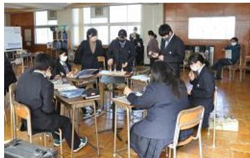
ハンドベル演奏の練習時の様子