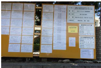
工事について表示されている 立て看板（校門入り口左手に設置）

ご来校の際には、工事車両等の出入り等もあり、ご迷惑をおかけいたしますが、ご理解とご協力をお願いいたします。