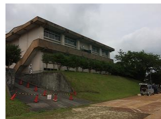
グラウンド側から見た格技場 工事車両が入るためグラウンドには鉄板が置かれています