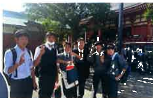
1年はクラスの親睦を図ることを目的に上野・浅草を散策。