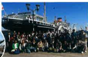
2年は海外修学旅行に向けて学習。成田空港から横浜方面へ。