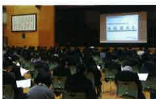
5月 3年進路ガイダンス