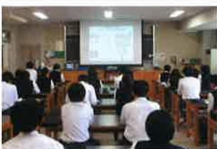
10月 2年進路ガイダンス