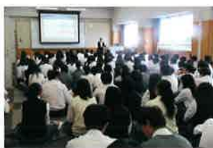
5月 3年進路ガイダンス