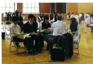
10月 2年進路ガイダンス