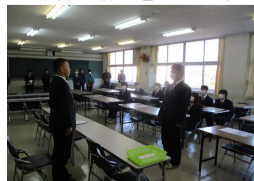
決意を表した選手宣誓

コンクールに先立ち、出場選手が集まり壮行会が行われました。選手代表が力強く宣誓をしました。