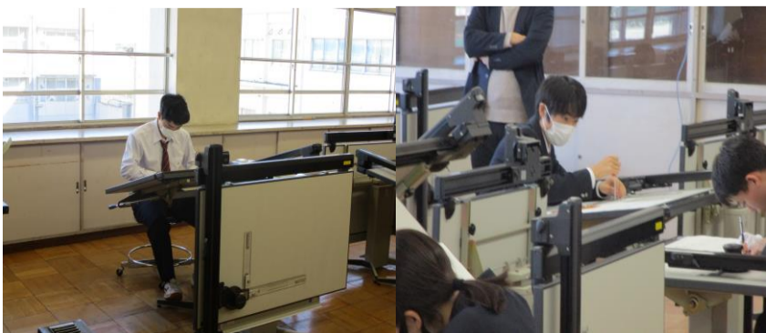
冷静沈着に競技を進めています