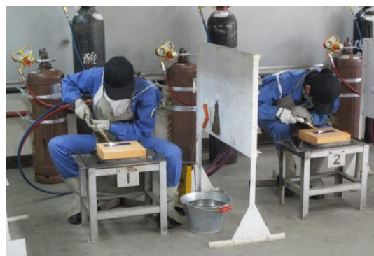
全体のトップバッターとして出陣