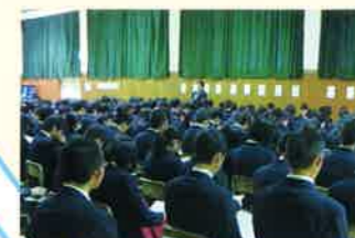
3年生による進路体験発表