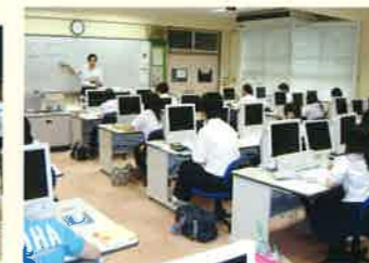
高度資格取得講座 (外部講師)