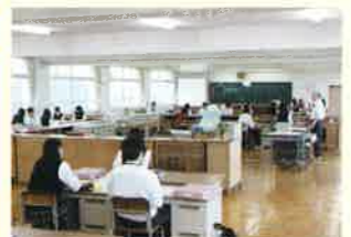
総合実践の授業(3年)