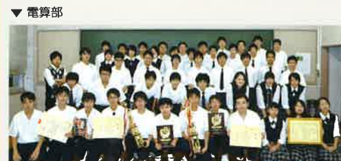
▲ビジネス研究班 関東生徒商業研究発表大会