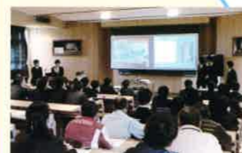
一宮町への提案会

プランニング発表会(総合実践授業) 高校生の視点から一宮町の活性化を提案しました。