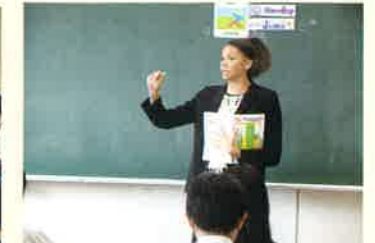
外国語指導助手 (ALT)との授業