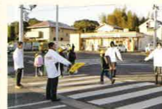
登校支援ボランティア