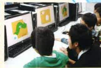
一宮小学校パソコン教室