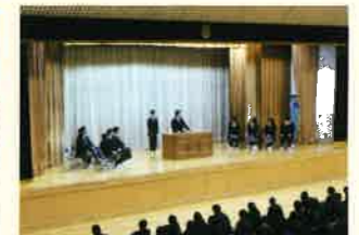
生徒会立会演説会