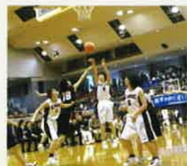
▲バスケットボール部

電算部 全商プログラミングコンテスト 優秀賞 ※36年連続入賞(全国) // 全国情報処理競技大会出場(個人) ワープロ部 全国ワープロ競技大会出場(団体・個人) ビジネス研究班 関東地区高等学校生徒商業研究発表大会優良賞 ソフトテニス部 全国高等学校ソフトテニス選手権大会出場(女子個人)