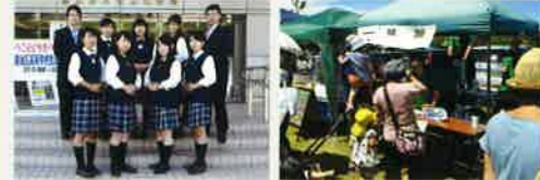
▲酒のファーマーズマーケット に出店