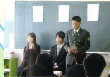
卒業生進路懇談会