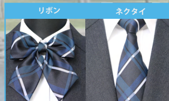
白と青と水色を 合わせたチェック柄