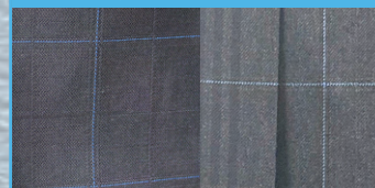
手賀沼のブルーと グレーのチェック柄