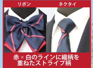
リボン ネクタイ 赤×白のラインに織柄を重ねたストライプ柄